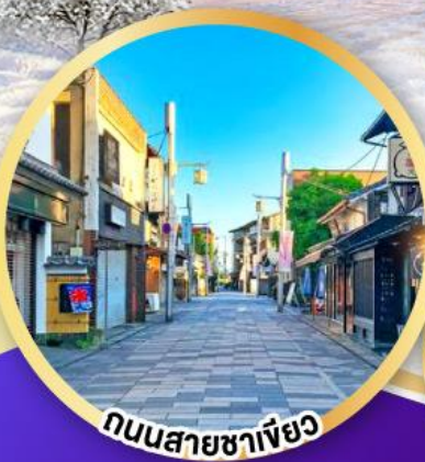
ถนนสายชาเขียว