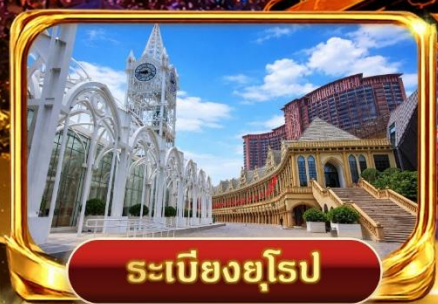
ระเบียงยุโรป