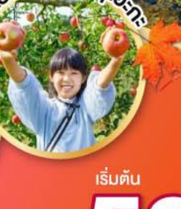
เก็บผลไม้เมืองชิซุโอะกะ