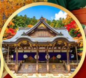
ศาลเจ้าอิสะ