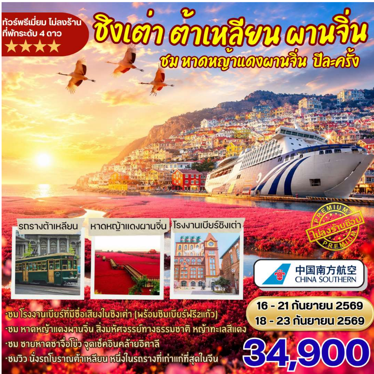
รถรางต้าเหลียน