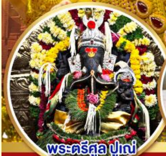
พระตรีศูล ปูเณ (Trishul Pune)