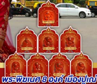
พระพิฆเนศ 8 องค์ เมืองปูเณ