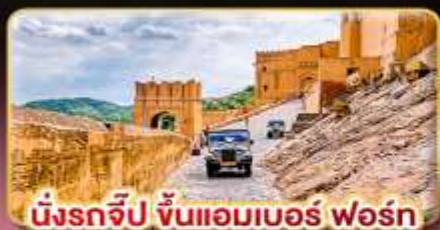
มิงรถจี๊ป ขึ้นแอมเบอร์ ฟอรั่ม